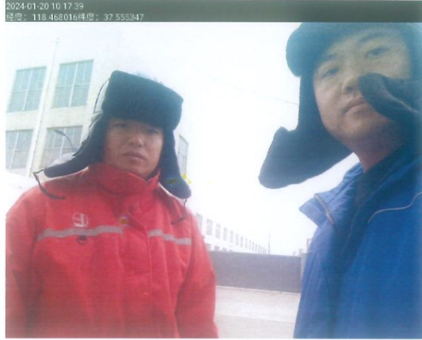
图 1 检测照片